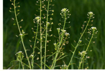
Kokoška pastuší tobolka